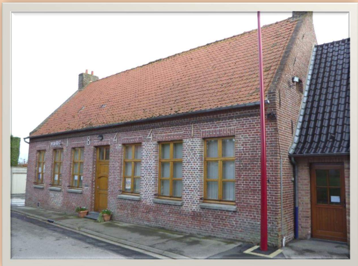
Aujourd'hui la mairie