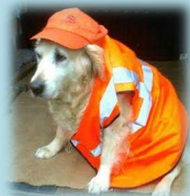
Voici notre Mascotte